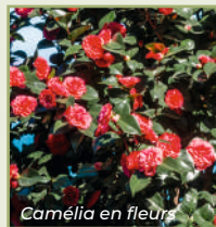
Camélia en fleurs